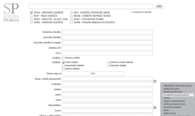
Slika 3 Pretraživanje sudske prakse u Sloveniji

Slovenija Na internet stranici www.sodnapraksa.si dostupne su sve odluke Vrhovnog suda Slovenije, te odluke drugostepenih sudova, Višeg radnog i socijalnog suda i Upravnog suda, kao i principijelni pravni stavovi plenarne sjednice Vrhovnog suda. [22]